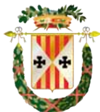
PROVINCIA DI CATANZARO